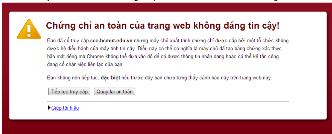
Hình 2: màn hình thông báo khi chạy đường dẫn website.