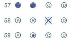
Hình 3. Tô sai