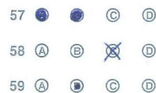
Hình 3. Tô sai